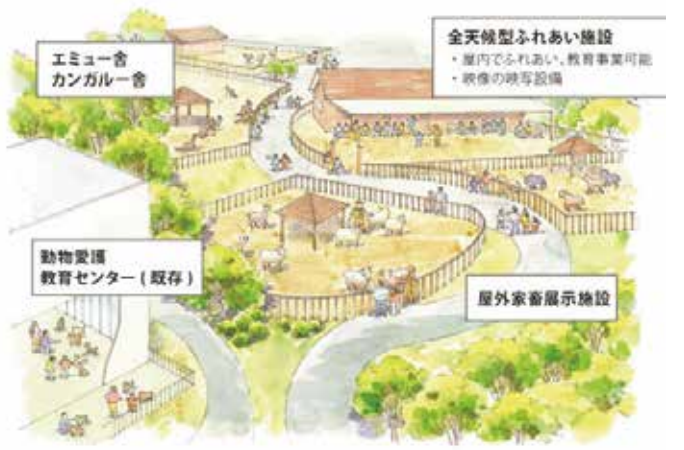
いのちのふれあいゾーン完成予想図

浜松市動物園 https://www.hamazoo.net/index.php