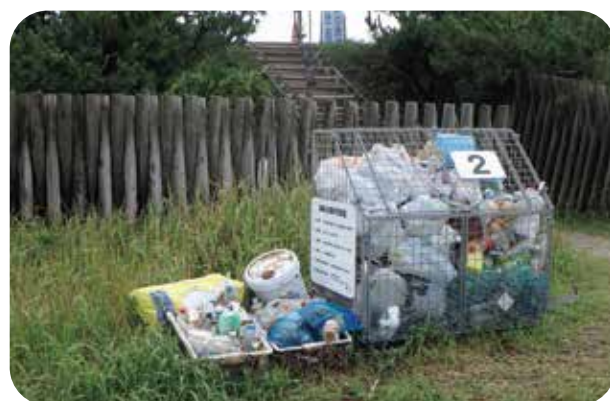
海岸に設置されたゴミ箱から溢れるプラゴミ 19.9撮影