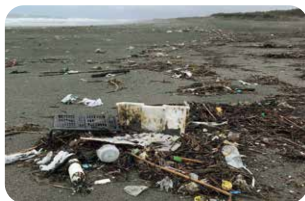
遠州灘海岸でプラゴミが散乱している様子 19.5撮影

遠州灘海岸には、未だに多くのプラスチック製の漂着物やポリ袋、ポイ捨てゴミが目につきます。現在、遠州灘海岸から海へのプラスチック流失とプラゴミのマイクロ化を阻止しようと、地元のNPO団体が、海岸の出入り口付近の10箇所にプラゴミ用のゴミ箱を設置し、市民の協力のもと早期回収を実施しています。今後も、このゴミ問題への対応を本市に働きかけていきます。